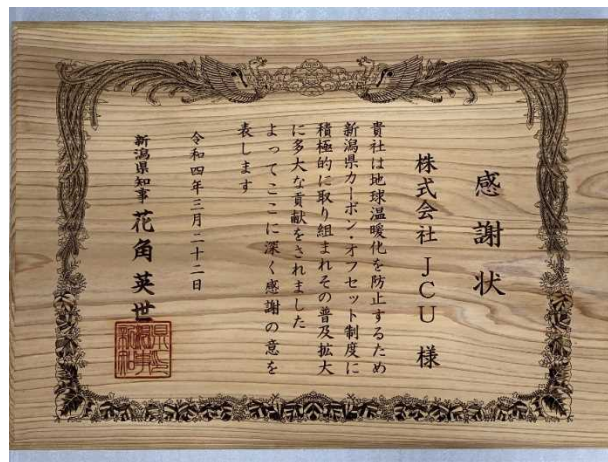
新潟県産のスギ材で作られた感謝状

当社は温室効果ガスの削減目標として、2030年度までに生産本部から発生するCO 2 排出量をゼロとすることを掲げています。今後も、目標達成に向けた削減対策を実施するとともに、継続して地球温暖化対策や森林生態系の保全に貢献してまいります。